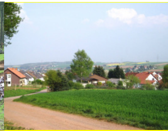
Blick auf Reisbach